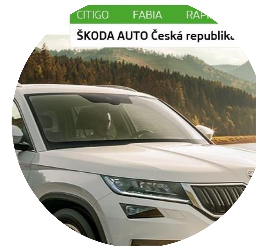
ŠKODA – AUTO